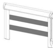
Model 23 / 24